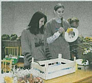
BUDOUCÍ zahradnice připravují vánoční dekorace.