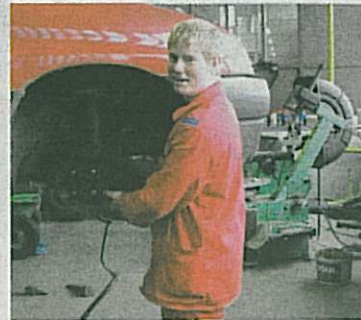
PRAXE žáků oboru Automechanik probíhá v dílnách učiliště.